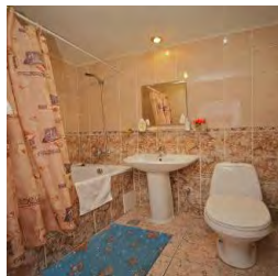
Санузел в стандарте