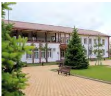
Фото номеров можно посмотреть по ссылке http://gkturist.ru/

Документы: паспорт, путевка, мед. страховой полис, свидетельство о рождении для детей.