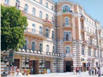
Главный корпус (№ 1)

Инфраструктура: конференц-зал, аптека, сауна, водоем, кинозал, банкомат, бар, ресторан, библиотека, детская комната, продуктовый магазин, спортзал, тренажерный зал, танцевальный зал, шахматы, настольный теннис.