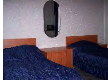
2-местный стандарт 2 категория