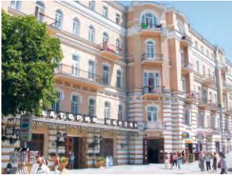
Главный корпус (№ 1)

Инфраструктура: конференц-зал, аптека, сауна, водоем, кинозал, банкомат, бар, ресторан, библиотека, детская комната, продуктовый магазин, спортзал, тренажерный зал, танцевальный зал, шахматы, настольный теннис.