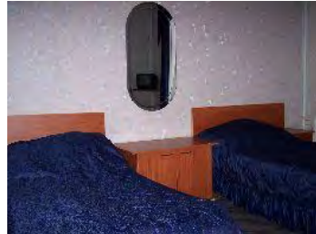
2-местный стандарт 2 категории